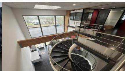
Hall entrée étage