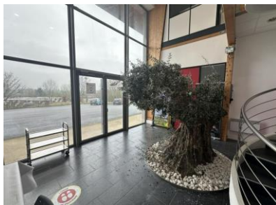
Hall entrée rez de chaussée